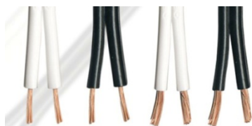
CLASSIC 42/79 STRAND